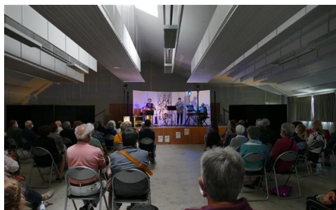
Fil de rêve