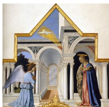
L'ANNONCIATION UNE MISE EN PERSPECTIVE