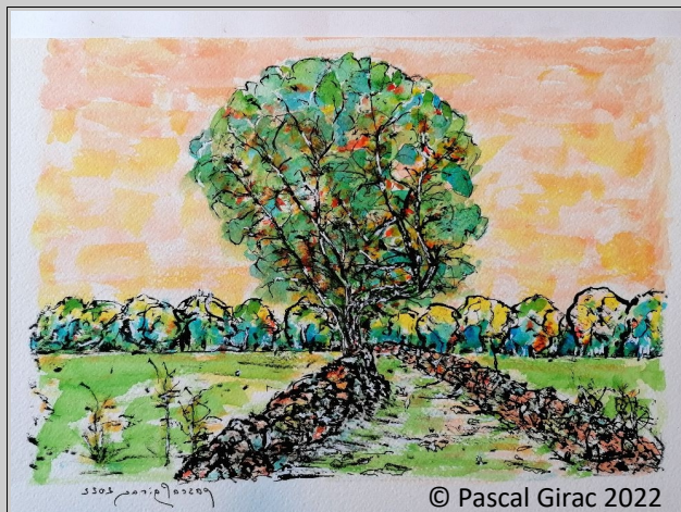
BONNES FÊTES ET MEILLEURS VOEUX 2025